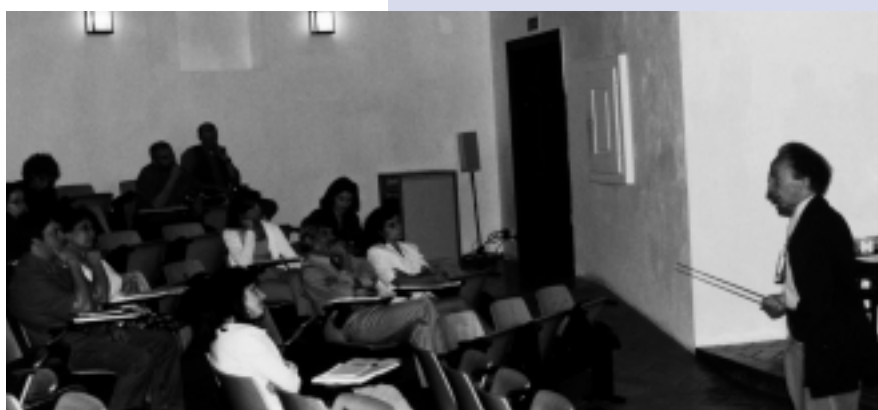
Acção de formação 3.1 “Introdução às práticas de conservação preventiva” Museu Arqueológico de S. Miguel de Odrinhas

Entre 1 e 4 de Outubro, a mesma acção de formação ocorrerá no Museu Municipal de Faro (4.2), com a colaboração da Câmara Municipal. ■