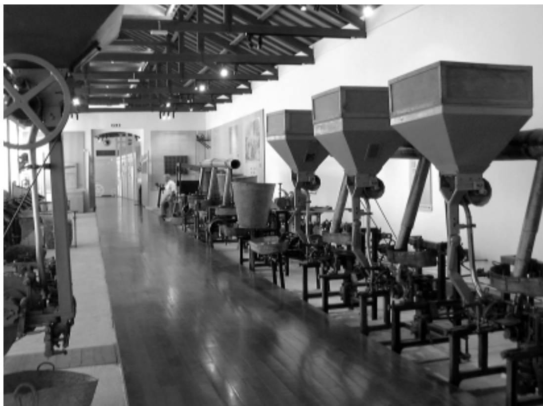
Museu da Cortiça da Fábrica do Inglês de Silves